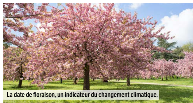
La date de floraison, un indicateur du changement climatique.

Un autre terrain prometteur reste à explorer, celui des données cachées dans des tiroirs, par exemple dans des cahiers, de professionnels ou non. Il y aurait là une mine d'or d'informations à récupérer et à analyser ! Avis aux amateurs.