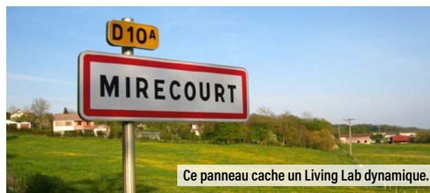
Ce panneau cache un Living Lab dynamique.

Un chargé de projet anime le Living Lab en organisant des ateliers, des groupes thématiques, en mutualisant et en faisant circuler l'information, en élargissant progressivement le cercle des acteurs, en favorisant l'émergence de chantiers participatifs. C'est l'occasion pour les chercheurs d'étudier in situ la construction d'un système alimentaire territorialisé.