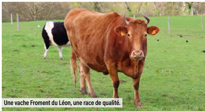
Une vache Froment du Léon, une race de qualité.