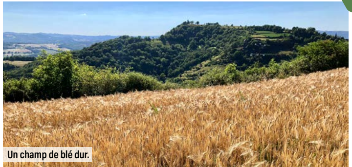
Un champ de blé dur.

À la fin des années 2000, les producteurs de blé dur bio (pour les pâtes, la semoule...) avaient testé toutes les variétés inscrites au catalogue français des semences. Mais les problèmes restaient entiers : les rendements étaient très faibles et la qualité insuffisante pour espérer bien vendre la production. La filière était en danger. Il fallait réagir. Avec Dominique Desclaux, de l'Inra, les agriculteurs ont eu accès aux anciennes semences gardées en réserve par l'Institut et les ont testées. Hélas, elles se sont révélées très sensibles aux pathogènes. La solution est venue d'un programme de sélection participative lors duquel de nombreux croisements ont été évalués par les paysans. Au bout de quelques années, une variété nouvelle a émergé (LA1823), satisfaisant tous les acteurs. La difficulté a ensuite résidé dans son inscription au catalogue. Les procédures d'homologation n'étaient pas adaptées au bio, mais les choses ont bougé, grâce au programme de l'Inra. Ce dernier a lui aussi évolué, et il se penche désormais sur l'hypersensibilité au gluten.