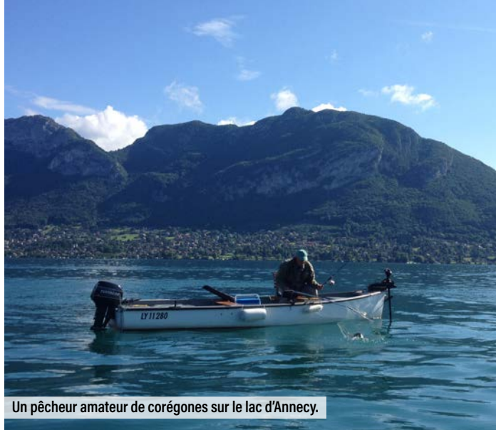
Un pêcheur amateur de corégones sur le lac d'Annecy.

D'une façon générale, au terme de ce rapide panorama, un constat s'impose : les sciences et recherches participatives favorisent le rapprochement et le dialogue entre sciences et société. En outre, en impliquant un public toujours plus large, elles contribuent à mieux faire connaître la démarche scientifique, ses méthodes, ses ambitions. Un atout essentiel aujourd'hui, quand l'importance des enjeux liés à la recherche est devenue telle qu'une certaine réappropriation de la science par les citoyens semble indispensable. Cependant, surtout quand le public prend une part non négligeable à sa construction, on doit veiller à ce que la science soit pratiquée à l'abri des doctrines.